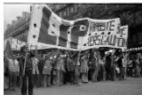
Histoire des mouvements sociaux

Vous pouvez pour en savoir plus aller ici